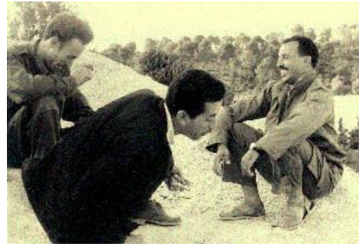
الرائد موسى مع الرئيس هواري بومدين