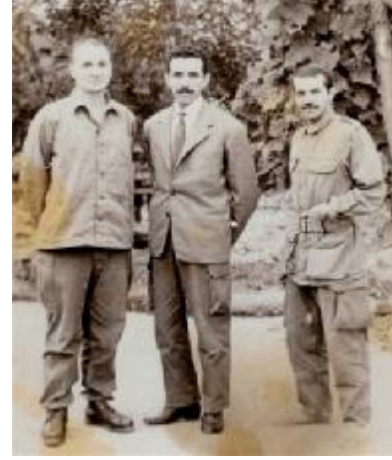
الرائد موسى مع الرئيس بوتفليقة